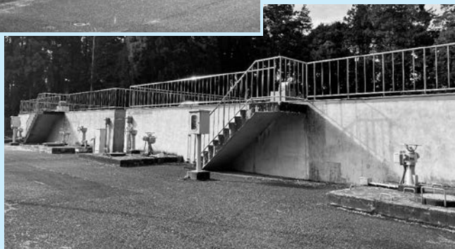
1号配水池 (右) ① 2号配水池 (左) ②