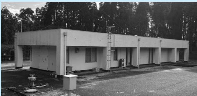
成東配水場 管理本館